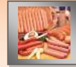
TABLA DE AHUMADOS TABLA DE SALCHICHAS