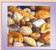
PAN DE AJO.